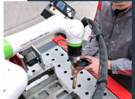
Einfache Schweißpfadprogrammierung durch direkte Brennerführung