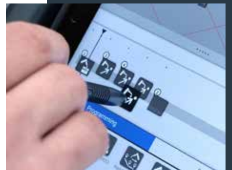
Programmerstellung per Drag & Drop