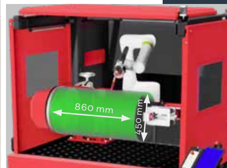
Bauteildimensionen mit Dreheinheit

Fronius Schweiz AG Obergatterstrasse 11 8153 Rümlang Schweiz T 0848 FRONIUS (37 66 487) F 0800 FRONIUS (37 66 487) sales.switzerland@fronius.com www.fronius.ch